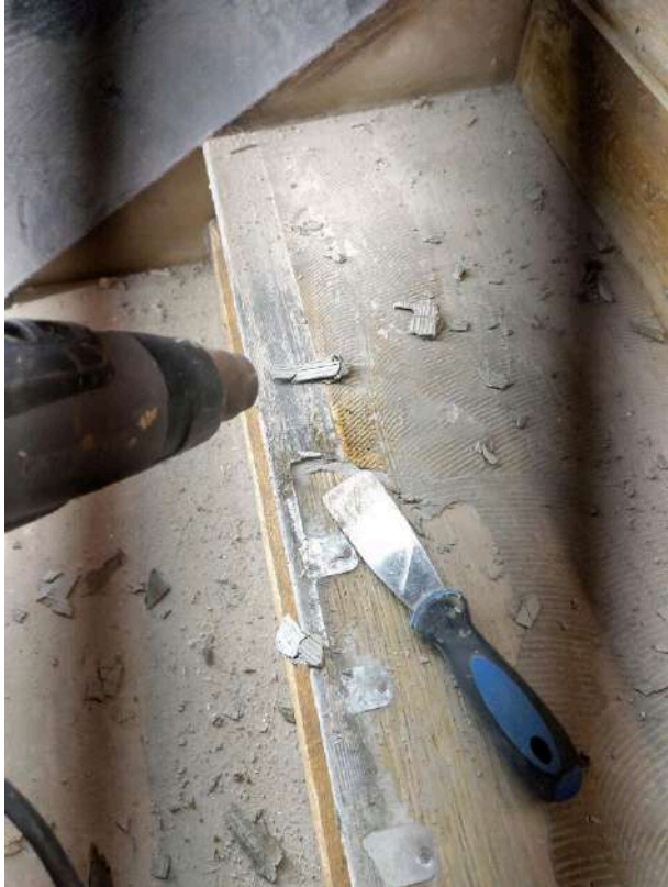
Entfernen Spachtelmasse mit Heißluftfön und Spachtel