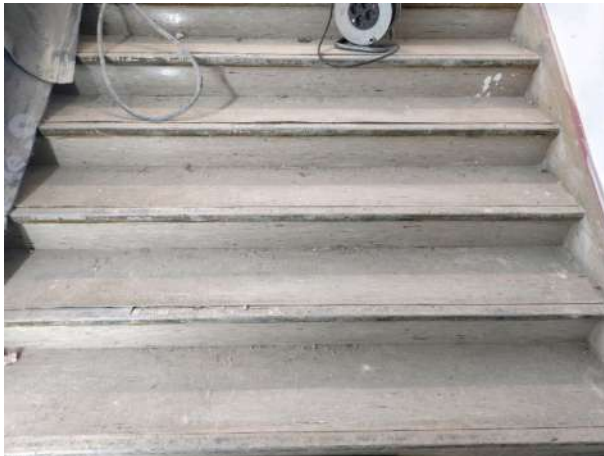
Vorzustand: Tritt- und Setzstufe mit PVC-Belag Stufenvorderkante Metallschiene