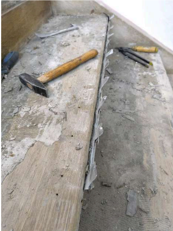
Metallschiene an der Stufenvorderkante entfernen , alle 5 cm genagelt